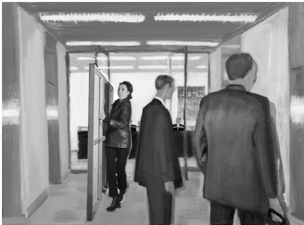
Abb. 3: Verena Landau, Kunstraub_Kopie 08 (Edition: KUNSTRAUB_KOPIE 01-13, Entstehungsjahr 2005, 1. Auflage [30 Ex. + 5 AP] zugunsten der Edition Kunst gegen Konzerne 2007, Digitale Fotomontagen, 21 x 29,7 cm)

Verena Landau (2007) wehrt sich gegen die ‚Funktionalisierung von Kunst durch die Wirtschaft‘: „Ich denke, dass man nach wie vor Unternehmen an einem neuralgischen Punkt treffen kann, wenn man ihnen den Zugriff auf Kunst entzieht.“ Landau würde Kunstwerke – darunter auch ihre eigenen – gerne wieder aus den Vorstandsetagen abholen (Abb. 3):