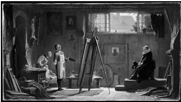
Abb. 1: Carl Spitzweg, Der Porträtmaler , 1852/55 (Öl auf Leinwand, 22,1 x 40,3cm, MGS 1506, Museum Georg Schäfer). Die Art und Weise, wie die Figuren dargestellt sind, zeigt die Ironie mit der Spitzweg verdeutlicht, dass das Porträtmalen reiner Broterwerb sein kann.

Dass Künstler mit Unternehmen oder Unternehmern zusammenarbeiten, ist kein Novum. Der geneigte Leser mag gleich an Stipendienprogramme für Künstler, an Preise und Auszeichnungen, an artists in residence oder andere Formen der ‚kunstbasierten Intervention‘ (BIEHL-MISSAL 2011) denken. Er vergisst dabei aber rasch, dass die Beziehung zwischen Künstler und Unternehmen respektive Unternehmer auch wesentlich grundlegender eine klassische Geschäftsbeziehung zwischen Käufer und Verkäufer sein kann und in der gesamten bisherigen (Kunst-)Geschichte auch überwiegend war. Der autonome Künstler, als nur sich selbst gegenüber verantwortlichem Genie, existiert erst seit dem 19. Jahrhundert. Die – allerdings nur noch vereinzelt zu findende – Vorstellung, dass die Kunst und ihre Erschaffer ohne die Wirtschaft auskämen, ist der gerade in Deutschland noch sehr hohen, staatlichen Förderung zuzuschreiben (PRIDDAT 1999: 106).